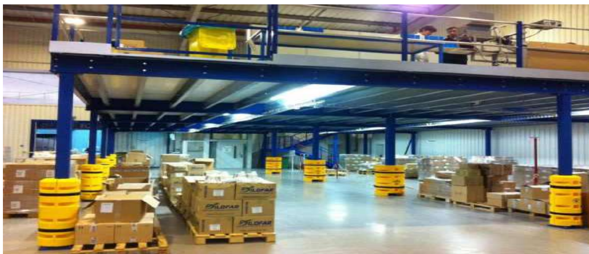
Figura 04 – Imagem da Área de Picking e Expedição

Destacam-se, assim, duas estratégias de carregamento: Agrupar diversos produtos solicitados, semelhantes ou diversos, formando uma única carga o que facilita o manuseio e o transporte dos materiais é até mesmo a redução de custos. Organização das cargas de acordo com a ordem das entregas a serem efetuadas: Acondicionar o carregamento dos materiais solicitados de acordo com a ordem das entregas a serem realizadas. Isto é, o último local de entrega deve ser o primeiro pedido a ser colocado no veículo e o primeiro local de entrega deve ser o último pedido a ser carregado.