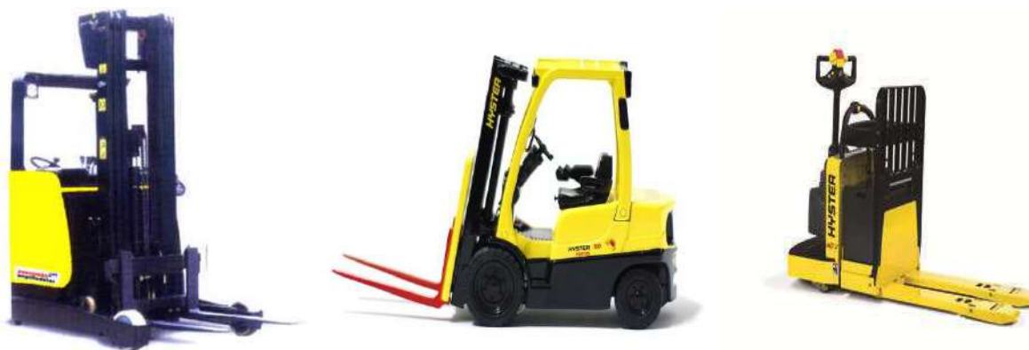
Empilhadeira Retrátil Empilhadeira a combustão